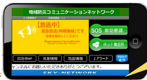
動作画面イメージ