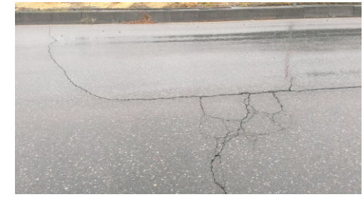
亀裂の入った道路