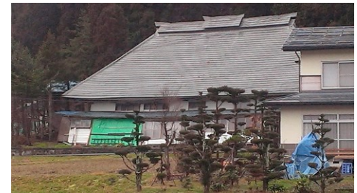
斜めになった家屋

分析: 震源地から遠くなるほど、長い猶予を持って発報された。 震源地に近い、北信州・東信州(端末A,B, C)では揺れる4, 5秒前に放送が入り、震源地から遠い、南信州(端末I)では28秒前に放送が入り、かなり待ってから揺れた。 高度利用タイプの緊急地震速報受信機は、地震の大きさと猶予時間を正確に発報された。