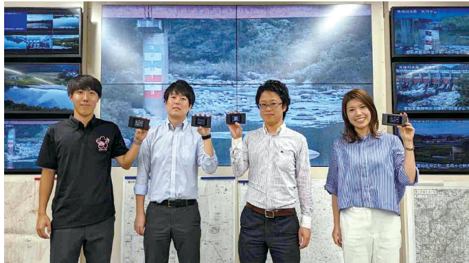
N3アクセスを持つ防災対策課のみなさま

災害時に市内すべての避難所の通信環境を確保する方法を検討していました。モバイルルータ「N3アクセス」は、4キャリア (docomo、au、SoftBank、Rakuten Mobile) 回線を使用できるので冗長性があり、万が一一つのキャリアが使えなくなっても他の3つのキャリアが使えるので安心できます。一部の避難所に避難者が集中した場合でも、持ち運びやすい可搬性のモバイルルータ端末なので通信環境を必要としている避難所などに効率的に配り、安定した通信環境を維持できるため導入しました。