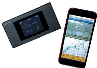
ポケットサイズで使いやすい N3アクセス(左)

市内121ヶ所のすべての避難所に「N3アクセス」を配備しました。1避難所あたり3台ずつの配備で合計363台です。「N3アクセス」1台で5台～10台のスマホなどが利用ができるということで、大規模な災害発生時の通信障害などの対応に使う考えです。そのほか、自主防災会などによる避難所の運営訓練の際にも活用を予定しています。