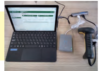
養父市様避難所受付端末

養父市様のニーズに合わせたデータベース構成およびマイナンバーカード連携のカスタマイズを実施し、やっぶるカード、マイナンバーカードと連携可能な避難所管理システムの構築を実施!!